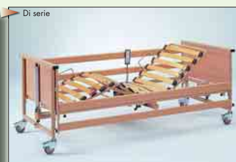
Versione con sponde in legno art. 51.0714.33