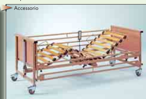
Versione con sponde in metallo art. 15.0604.115