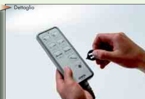
Pulsantiera con blocco delle funzioni