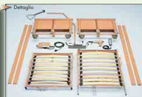
I componenti del letto