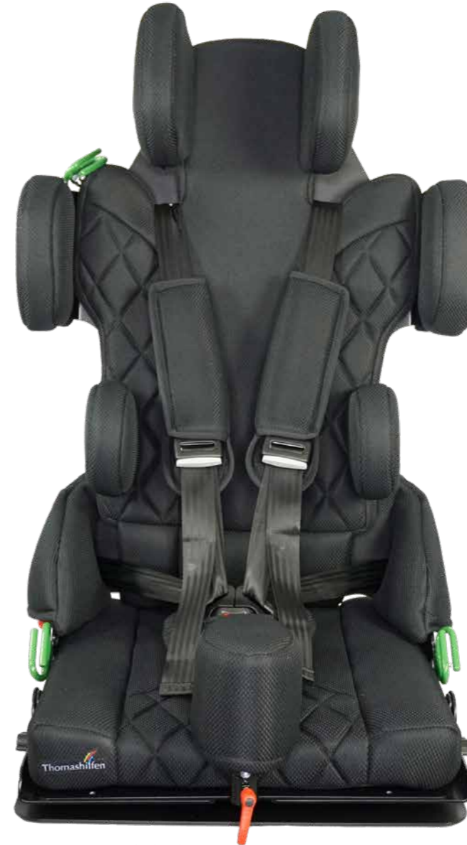
L'immagine include alcuni accessori

Ora con PROTEZIONE DAGLI URTI LATERALI E NUOVO POGGIATESTA