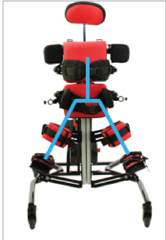
Extra abduzione (4-in-1)