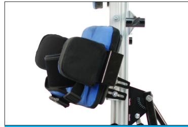
Funzione di inclinazione e rotazione disponibile per i supporti pelvici e toracici