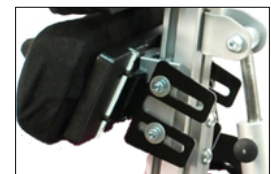
Regolazione dell'inclinazione e della rotazione disponibile per il supporto lombare e della schiena