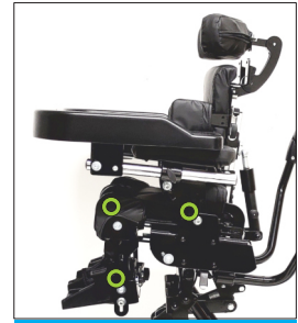
Posizionamento anatomicamente corretto dei punti delle articolazioni